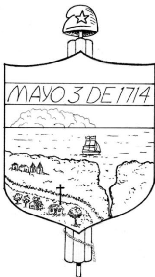
Escudo de Santa Cruz del Norte

REFERENCIAS HISTÓRICAS: Según versiones de la tradición oral, en la zona que ocupa este municipio existía un conde propietario del ingenio de la localidad de apellido Santa Cruz, el cual tenía en la hacienda ganado, que para coger sombra se dirigía a una arboleda, donde había una cruz de gran tamaño, de ahí el nombre de Santa Cruz del Norte.