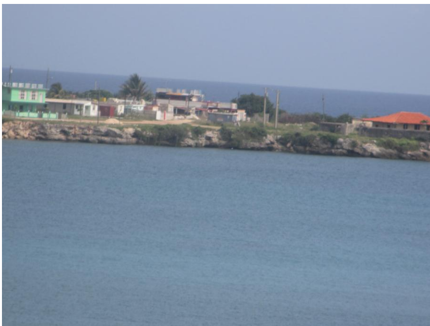
Playa El Fraile