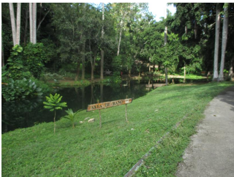
Rio Santa Cruz