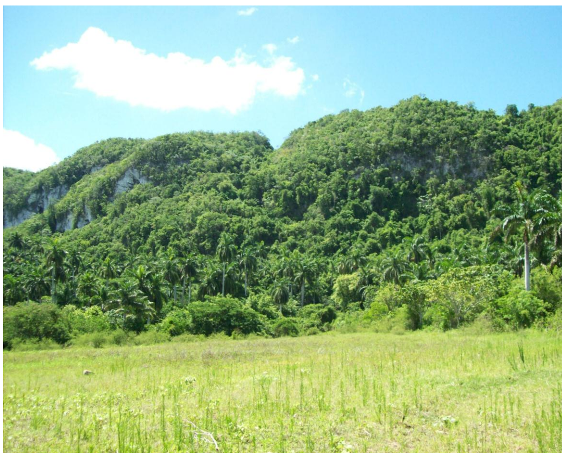
Sierra de Camarones