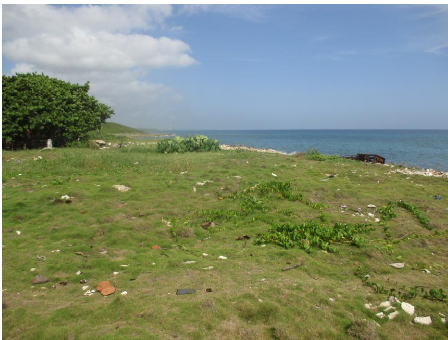
Boca de Jaruco

Nota: En este resumen no está incluido La Falda , pues a pesar de estar incluido este accidente geográfico en el Diccionario de la provincia, no se define su clasificación genérica.