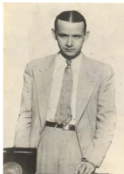
Antonio Guiteras Holmes