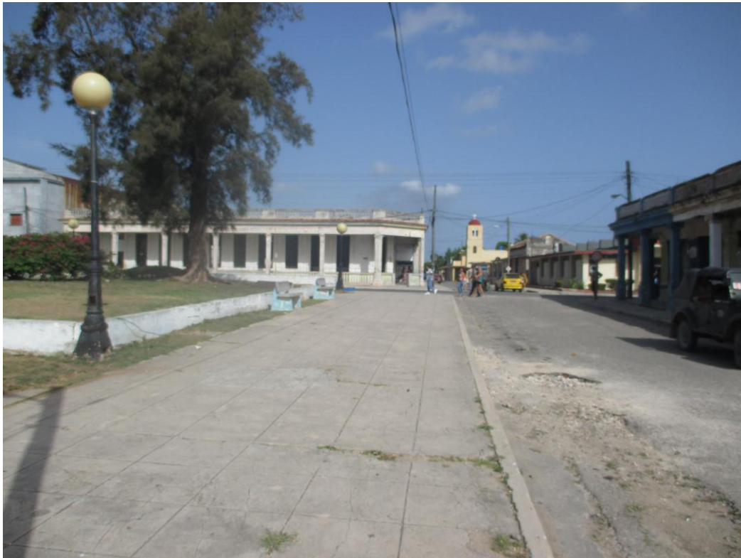
Santa Cruz del Norte