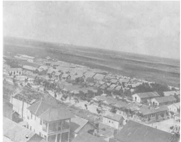
Vista del poblado de Manatí desde el mirador del central.

Comienza a realizar oficialmente sus operaciones el 21 de febrero de 1913, cuando el vapor Rafael Morales, Capitaneado por Everardo de Aguirre, se encargo de reconocer y balizar sus alrededores, colocando las boyas de acceso para grandes vapores, aunque el muelle no fue concluido