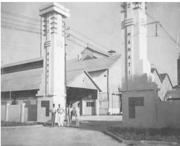
Entrada al central Manatí (Fortín).

Cuba en 1899 aún se encontraba bajo los efectos de la guerra, con una parte de la economía en ruinas, prevalecía el abandono, de la agricultura, la destrucción e insalubridad, el hambre y la miseria recaían sobre la mayoría de la población. En medio de esta situación las fuerzas