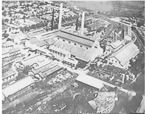
Vista aérea del central Manatí.

norteamericanas de ocupación tomaron la medida de hacer un censo de la población Cubana para conocer su estado: la fuerza laboral existente, la distribución de la población en los diferentes departamentos de la Isla y otros datos necesarios para proyectar la reconstrucción del país y fomentar las inversiones del capital financiero norteamericano.